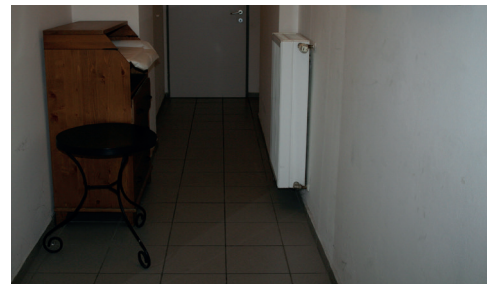
Gang zu WC