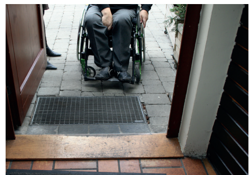
Zugang vom Gastgarten