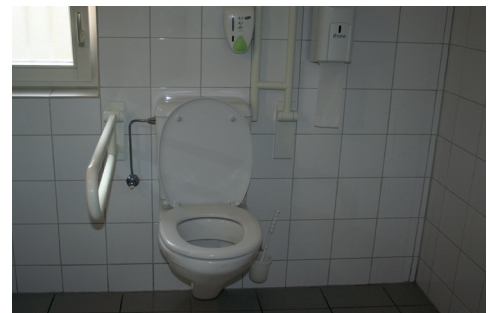
WC und Plan WC

Stand: Mai 2012, alle Angaben ohne Gewähr, Graz Tourismus in Zusammenarbeit mit der Behindertenselbsthilfegruppe Hartberg