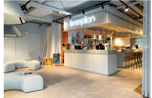
Rezeption und Lobby