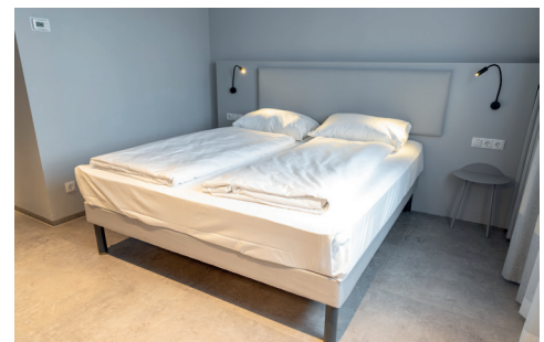
Barrierefreies Zimmer Nr. 128