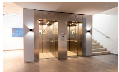
Lift und Treppe