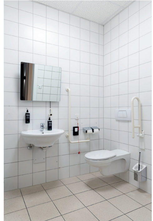
Allgemeines barrierefreies WC